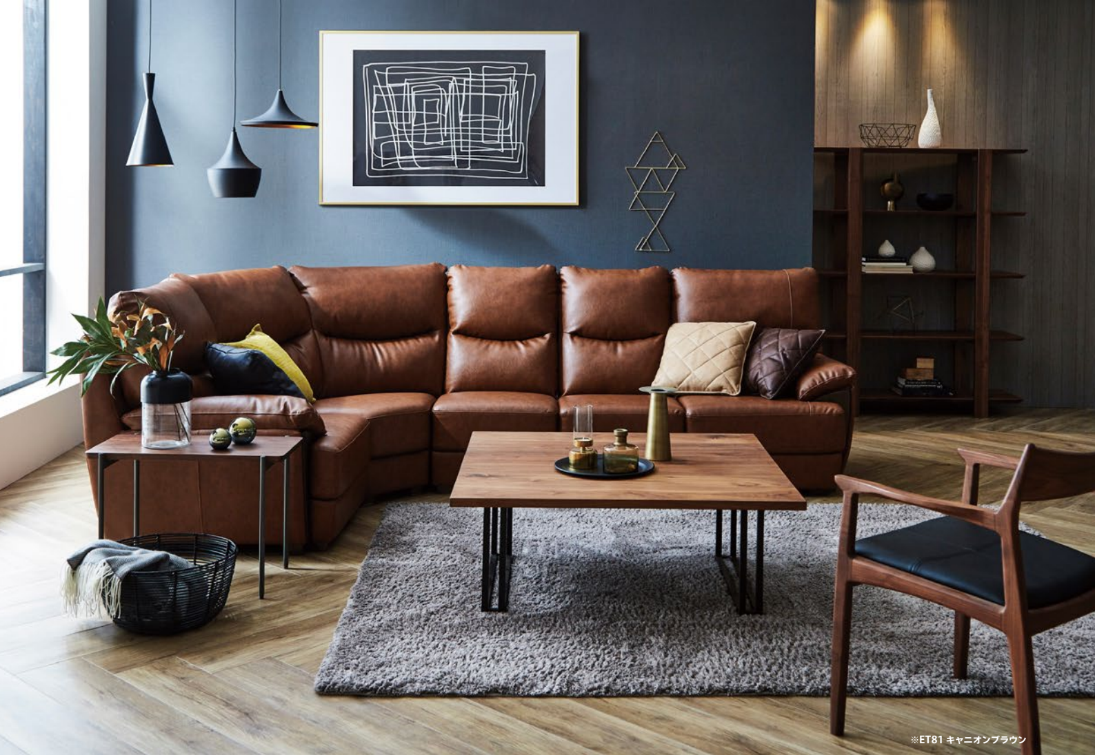
※ET81 キャニオンブラウン